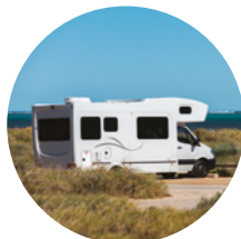
Camping-cars & véhicules utilitaires