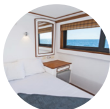
Cabines de bateau