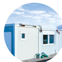
Modules préfabriqués & locaux techniques